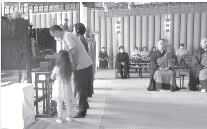
8月16日にはご家族そろってお参りください