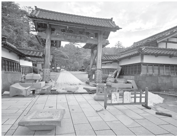
能登地震で被災した能登祖院