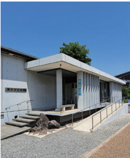
涼しい休憩所でお休みください

年々増してくる 夏の暑さ。特にご高齢の方には熱 中症が心配です。夏場のお墓参り には、涼しい休憩所でひと休みさ れることをお勧めします。また、 お一人でお墓参りせず、ご家族同 伴でのお参りを心掛けてください。