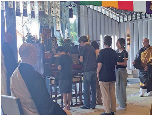
8月16日、9月26日にはご家族そろってお参りください

謝をささげるとともに、ご自分の生き方を見つめ直す大切な期間です。彼岸に足を運んでご先祖様に手を合わせ、今あることに感謝いたしましょう。ご都合が悪い方は、いずれの法要も不参加にてお申し込みできますので、お問い合わせください。